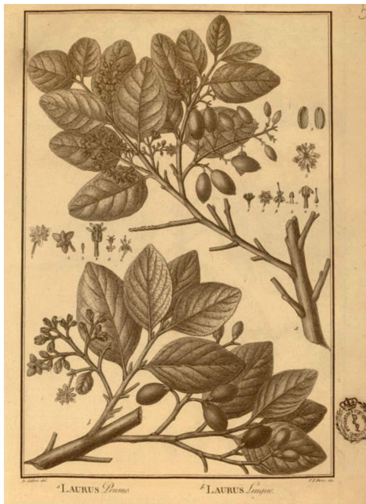
Figura 2 Joseph Pavón, Laurographia , 1805.

Obra que contiene 28 grabados calcográficos con reproducciones de especies del género Laurus . Fue aprobada en sesión de la RAMM de 22 de agosto de 1805. Era el regalo que se hacía a los Académicos tras su nombramiento.